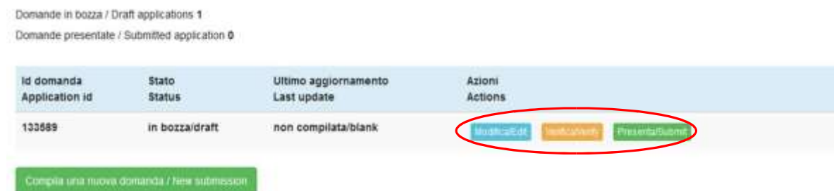
Figura 5 – Verifica e presentazione della domanda.

Per presentare la domanda si dovrà cliccare su "Presenta/Submit" (fig.5).